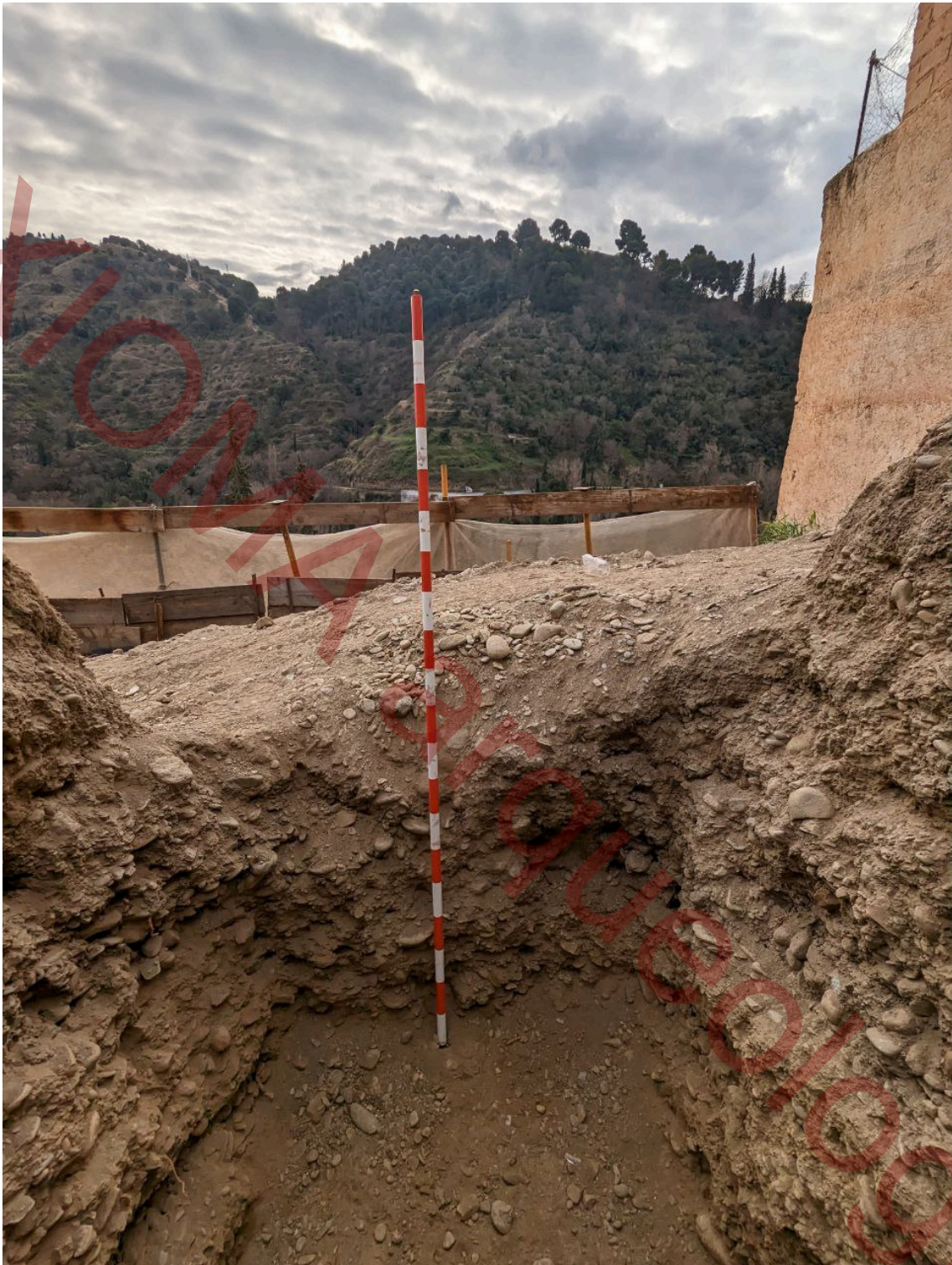
Perfil sur del mismo sondeo totalmente compuesto de niveles estériles.