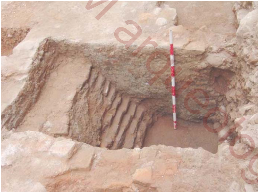
Figura 3 – Sondeo 1 – horno.