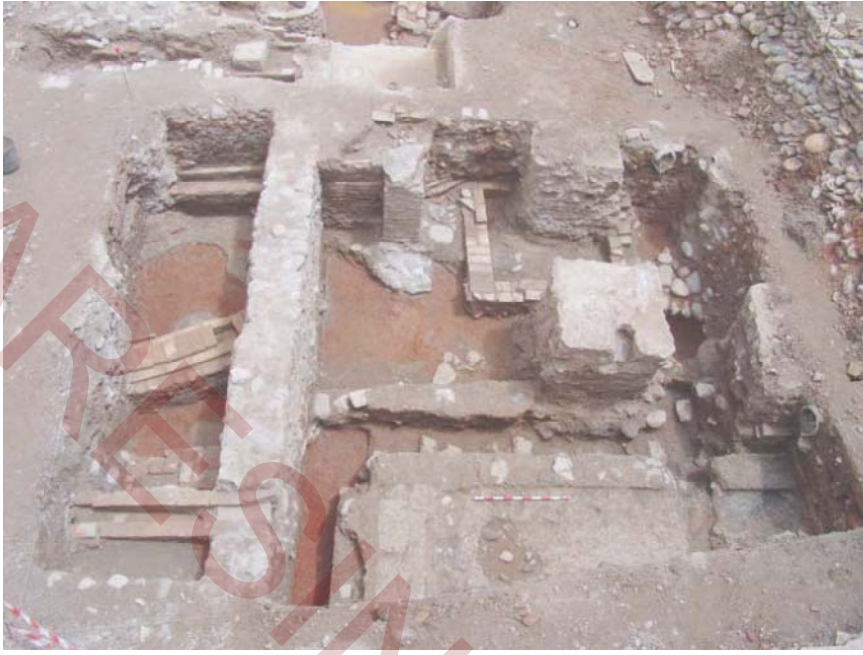
Figura 2 – Sondeo 3 – niveles nazaries.