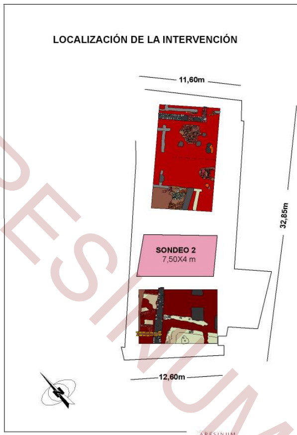
Figura 4 – Planimetría general.