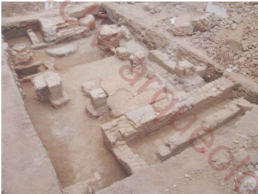
Figura 1 – Sondeo 1 – vivienda nazarí.

los muros perimetrales, claramente relacionada con restos de un muro que discurre en paralelo a ella y que tienen la misma dirección que los muros de la vivienda del sondeo 1. Esta plataforma parece haber estado cerrada por muros de los que tan solo se conserva un alzado de milímetros rodeando la plataforma y apoyando sobre ella. Con la misma dirección se han encontrado restos de otro muro de tapial que parece más antiguo que la plataforma lo que indicaría la presencia de dos momentos de ocupación en la zona. Este dato no queda claro totalmente debido a la ausencia de material cerámico en la zona y la poca diferenciación entre los tapias, debido a la escasez y poca entidad de los restos.