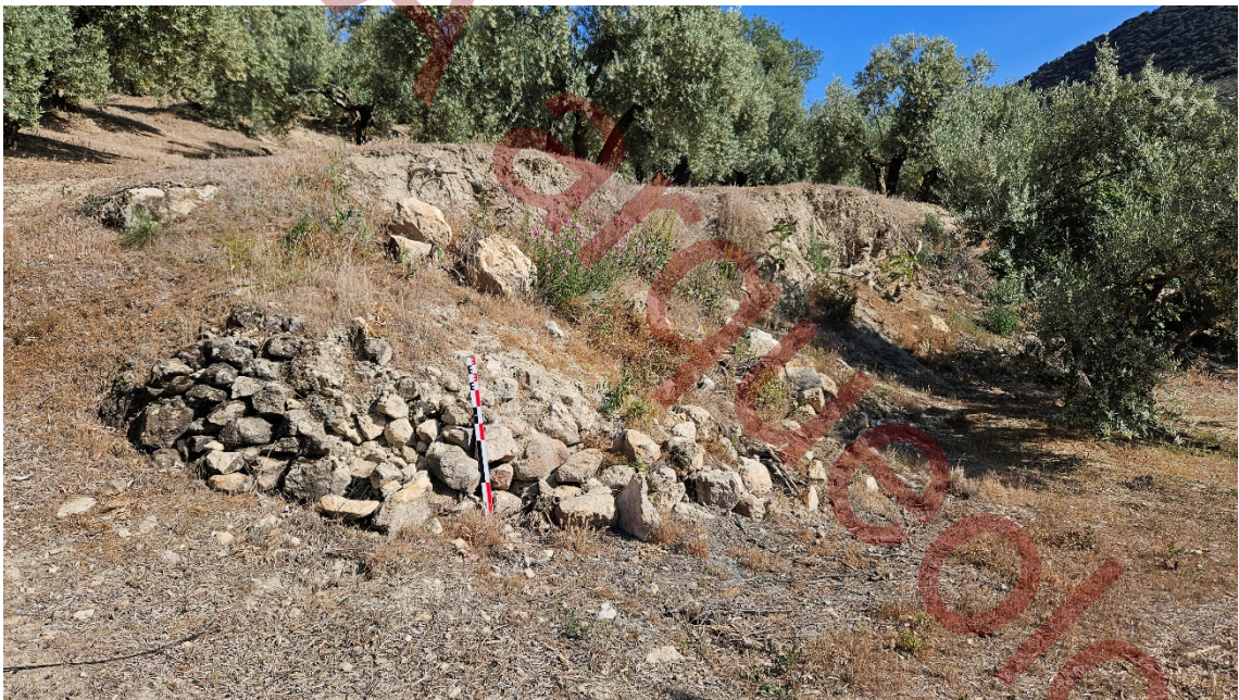
Restos de parata derrumbada con grandes mampuestos fuera de su localización.