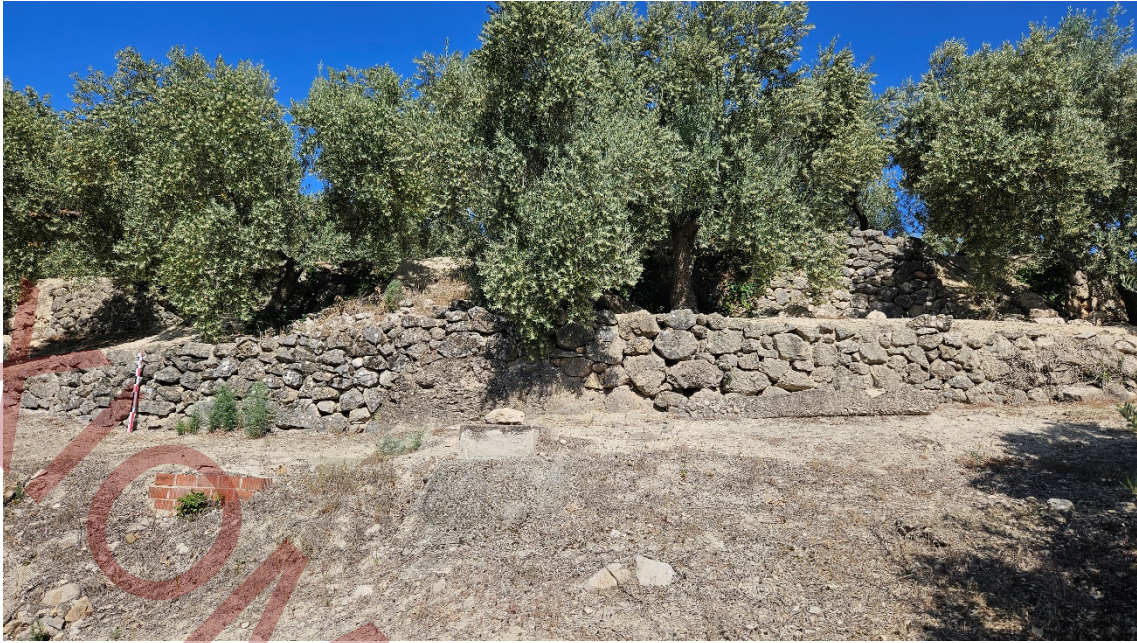
Parata de mampuestos de caliza con la presencia de pozos y registros y restos de canalizaciones de hormigón.