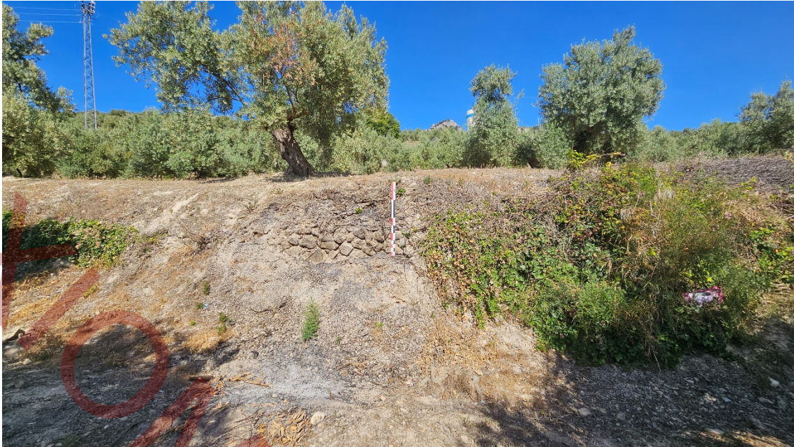
Muros de contención del terreno parcialmente cubiertos por los procesos erosivos de la parte superior