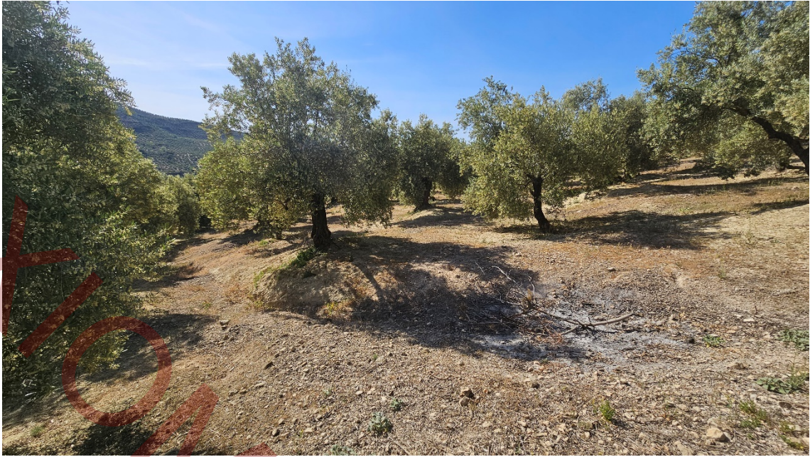
Vista de la parcela desde el límite este en su parte inferior.