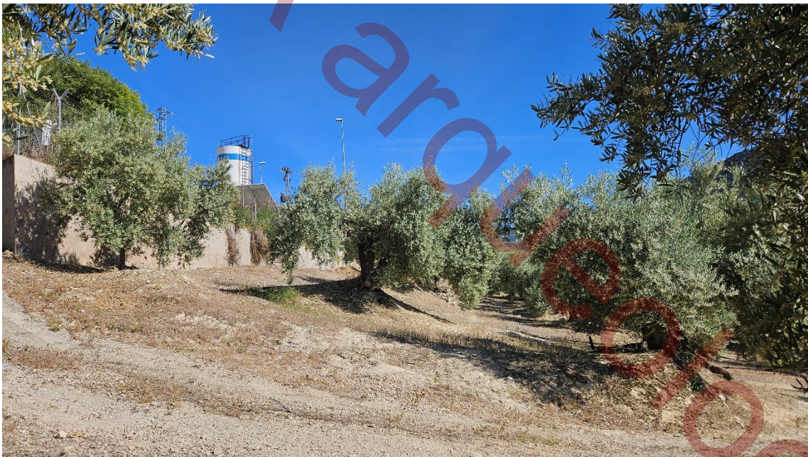
EDAR actual desde el Oeste de la parcela