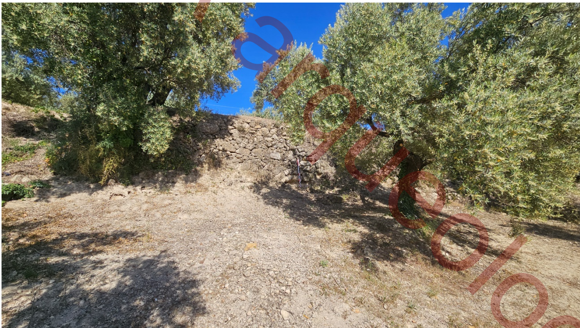
Muro de contención anterior en su desarrollo hacia el Este