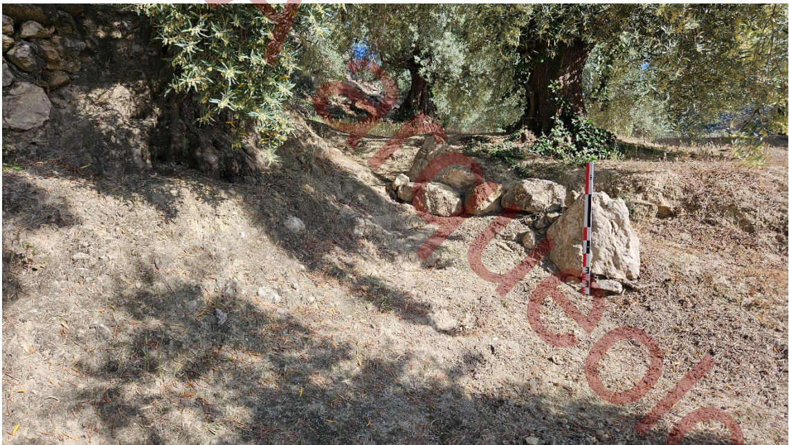
Grandes rocas provenientes de la zona superior y desplazadas por la implantación de tuberías