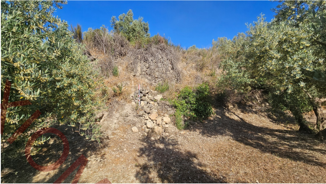
Elemento de mampostería de 3 metros y medio de altura, muy alterado.