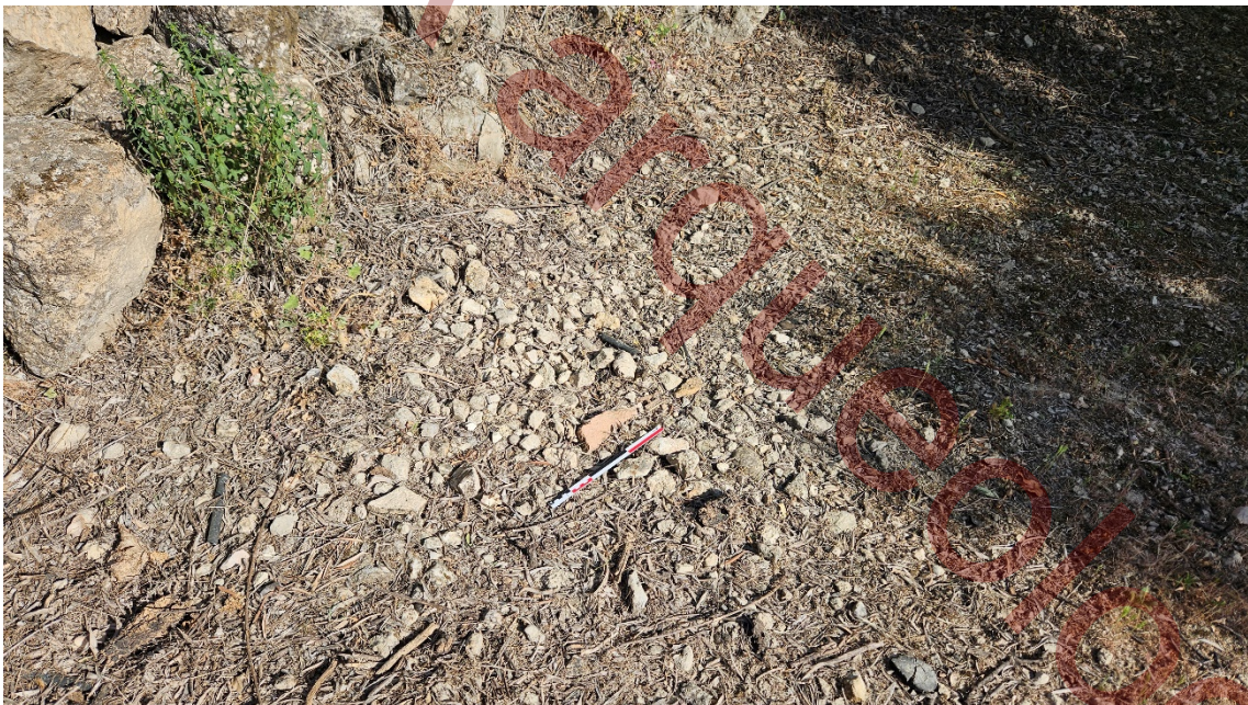
Fragmento de ladrillo macizo de 5 cm de grosor.