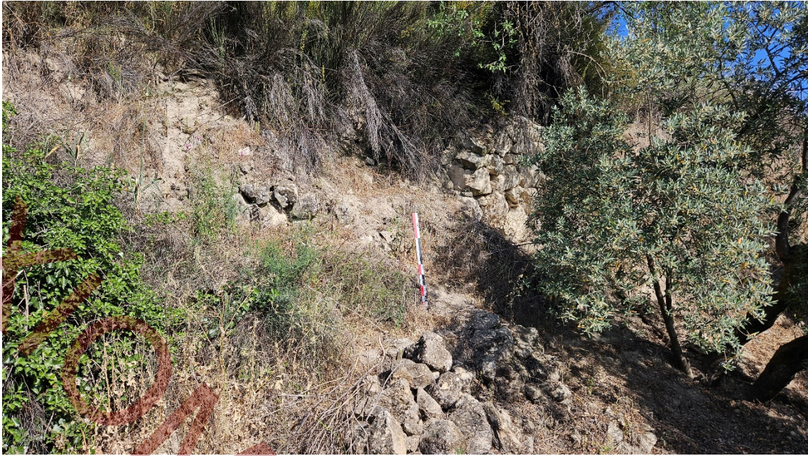
Muro con desarrollo semicircular muy alterado y cubierto por vegetación. Alcanza los dos metros y medio de altura.