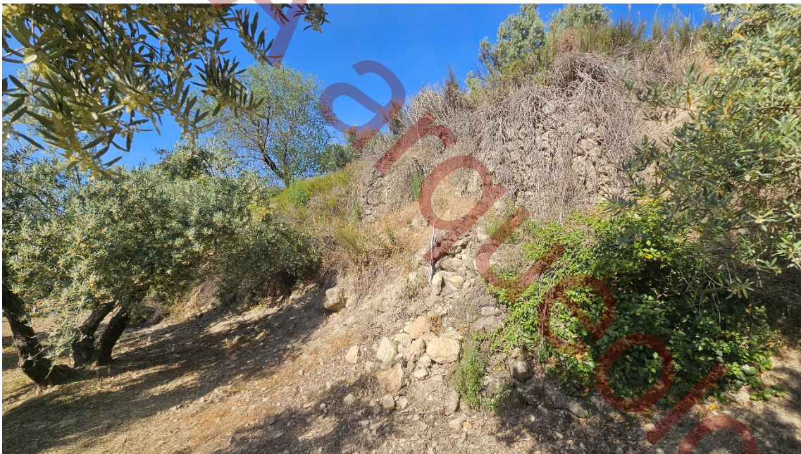
Vista del mismo elemento desde el Este.

Recomendamos realizar una limpieza de vegetación y un estudio paramental de estos elementos de importante desarrollo vertical para comprobar si se trata de muros de aterrazamiento o de otros elementos muy alterados.