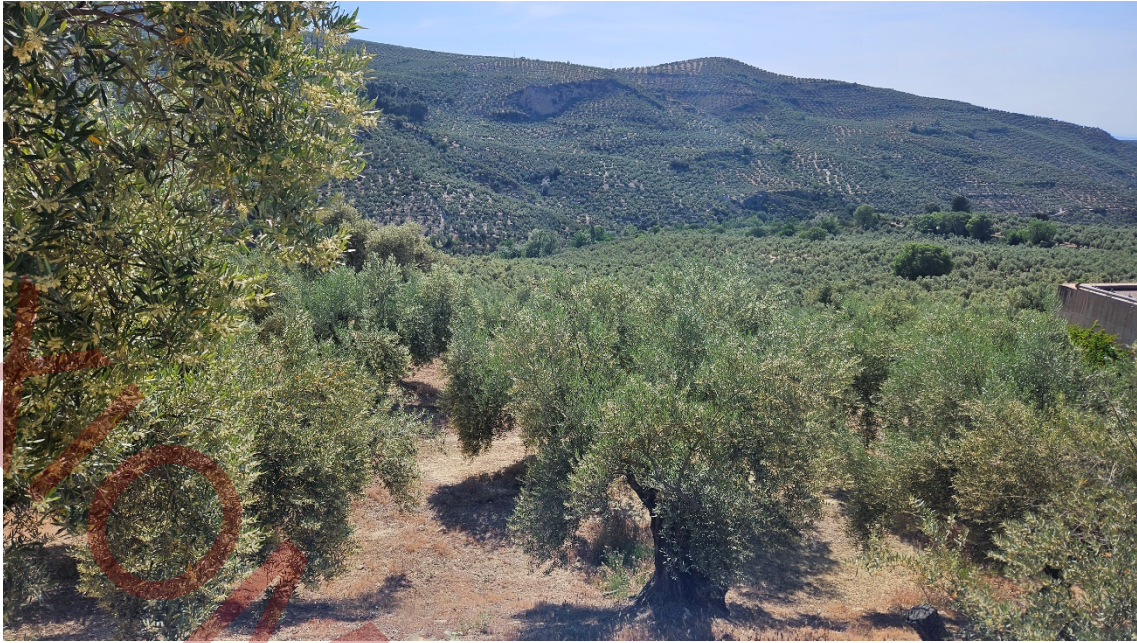
Vista de la parcela desde el Norte con el EDAR a la derecha.