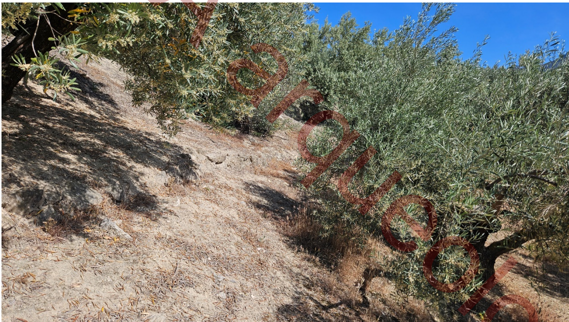
Murete de contención de escasa potencia en la zona Norte de la parcela.