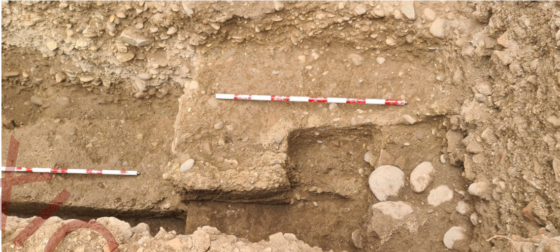
Detalle de la zona más cercana a la medianería con el retranqueo señalado.