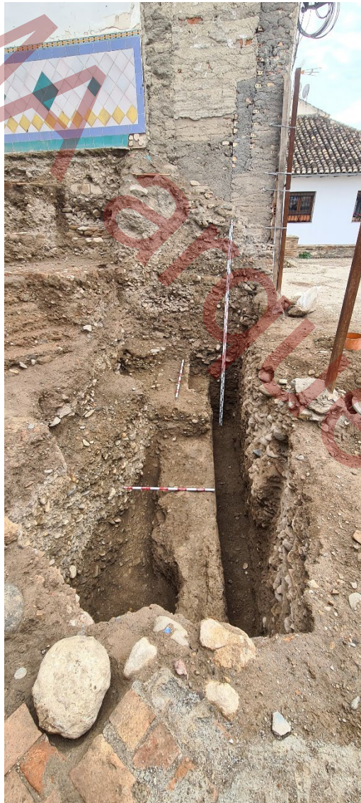
Vista de la zona de fachada y de UE 043 desde el Norte.