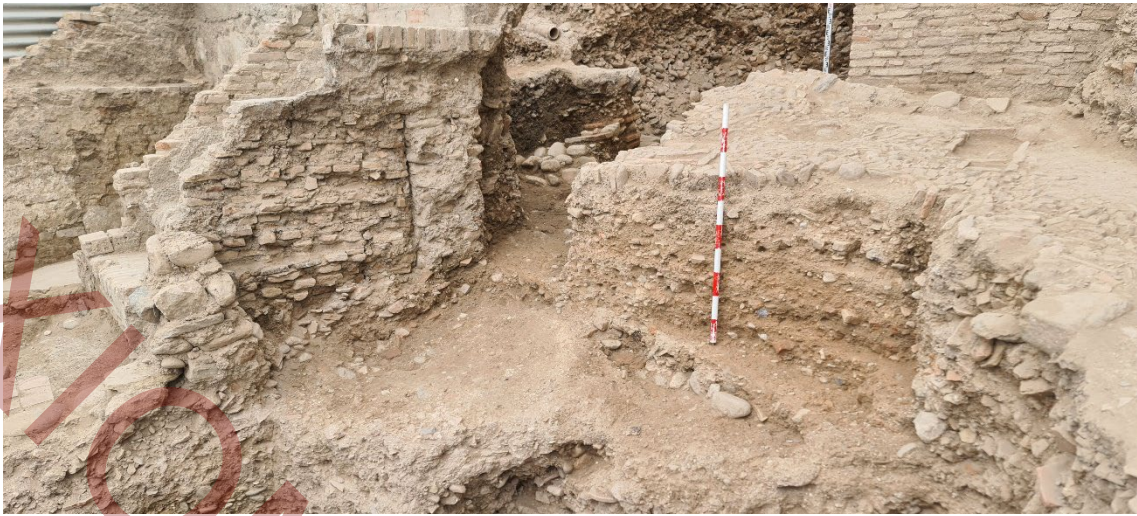
Niveles bajo empedrado UE 017