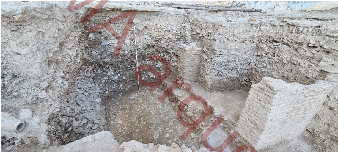
Nivel geológico localizado entre los muros UE 027 y UE 028