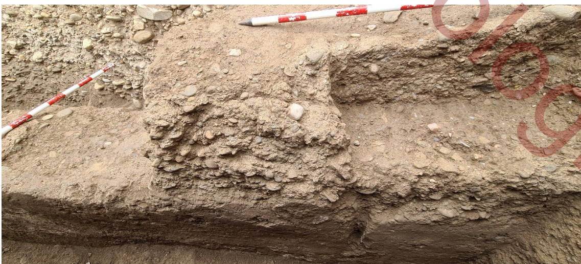
Detalle del enfoscado exterior del muro.