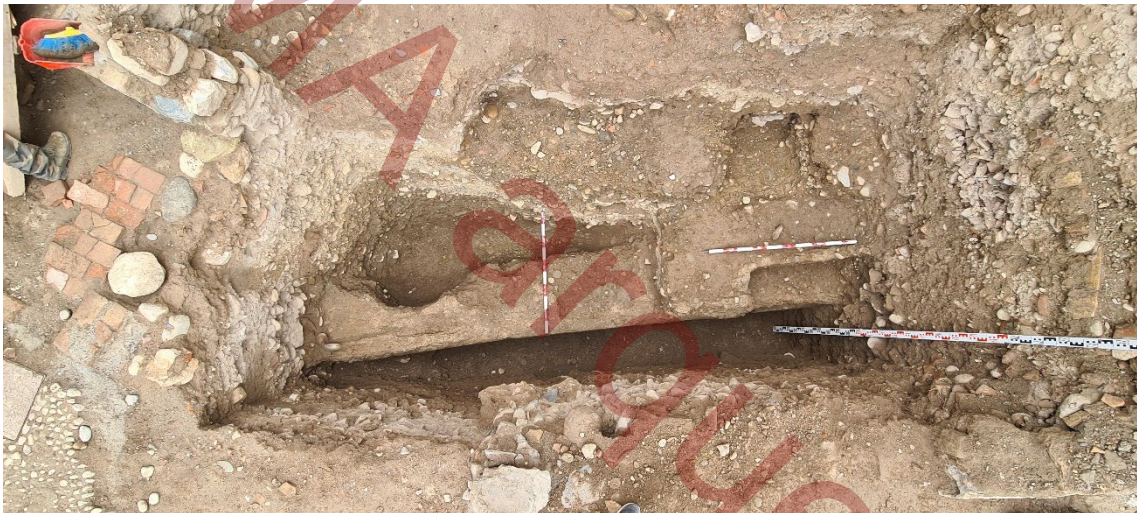
Fotografía cenital del muro 043 desde la zona de fachada.