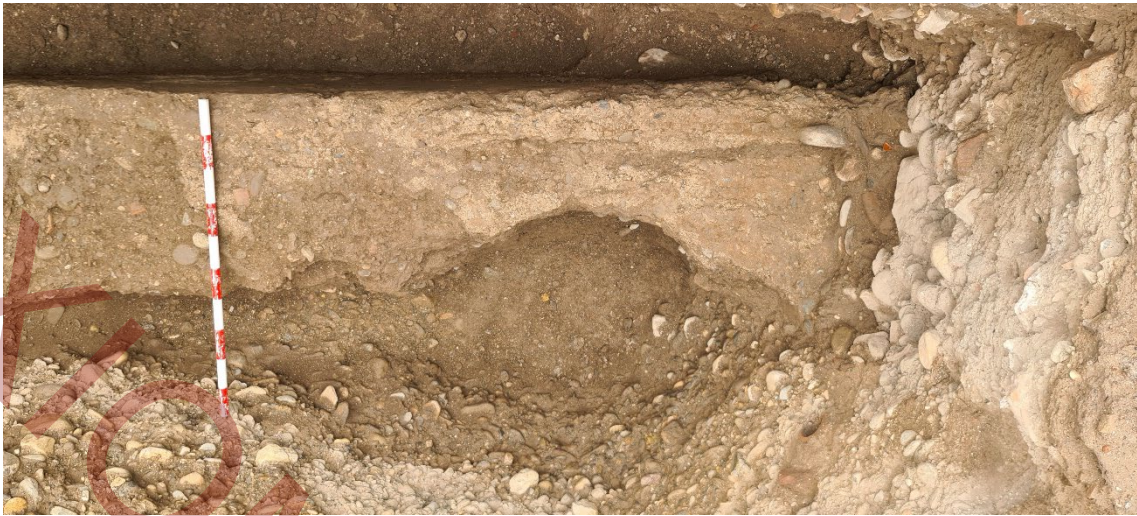
Detalle de la costra de cal exterior del muro.